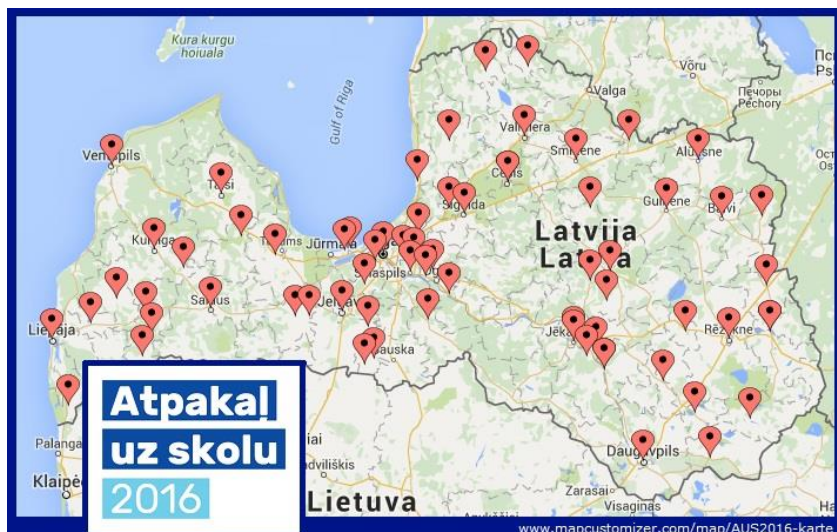
2016. gadā akcijas „Atpakaļ uz skolu” ietvaros apciemoto skolu karte

Atbilstoši savām laika iespējām, eksperti var izvēlēties, kuru izglītības iestādi apmeklēt un cik daudz laika veltīt dalībai akcijā.