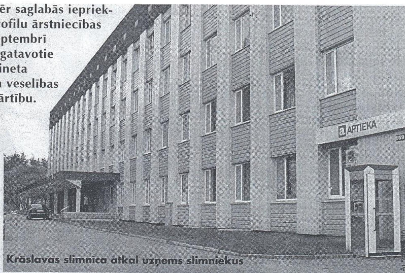
Krāslavas slimnīca atkal uzņems slimniekus

Iespējams, veselības ministru maiņas un citas problēmu dēļ dokumenti bija palikuši bez ievērības, tāpēc nācies šo jautājumu atkārtoti celt gaismā un pierādīt savu.