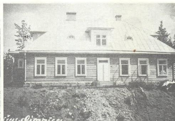
Bukmuižas doktorāts ap 1935. g.