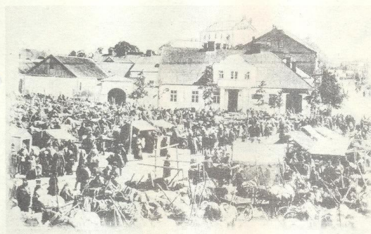
Крәславы, Баарный плоцад и Немецкая ул.