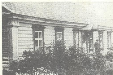
Dagdas slimnīcas ēka ap 1938. g.