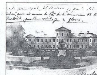
Šāda pils redzama vairs tikai uz pastkartēm

šām žēl, ka neviens pretendents uz pili nav pieteicies, jo atkal viss process ir apstājies.»