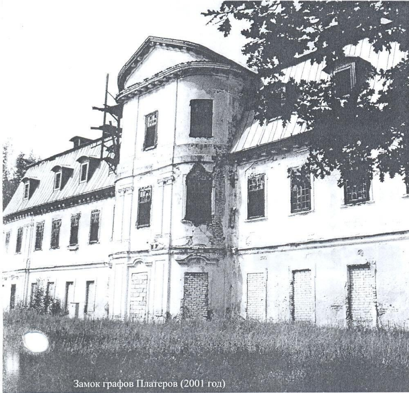
Замок графов Платеров (2001 год)

каретных дел мастера, ювелиры. Здесь печатались игральные карты, производились печные изразцы для облицовки каминов.