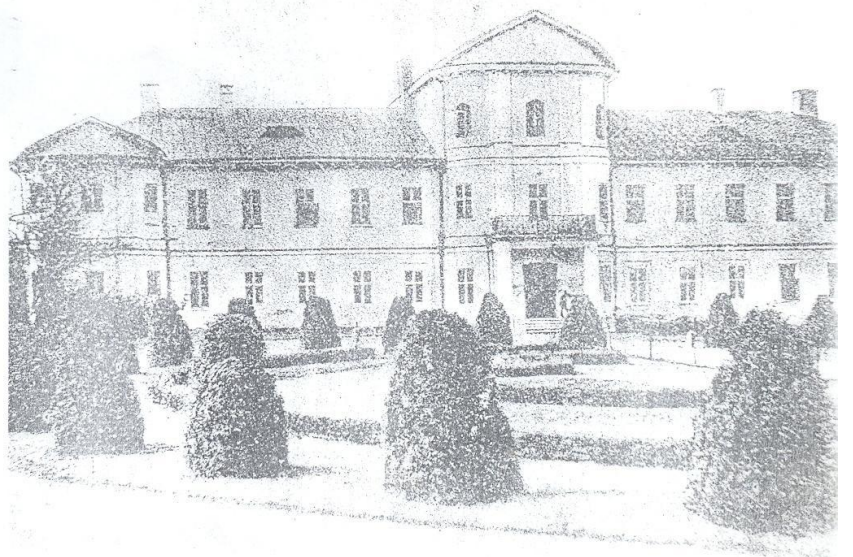
Замок графов Платеров (начало XX века)

С именем Платеров, представлявших опоясанный немецкий род, связано много страниц в истории Краславы, но расцвет строительства и экономики приходится на период жизни сына Яна Людвиг Платера-Константина. Он завез сюда ремесленников из польских местечек, пригласил архитекторов и художников из Италии. Жили и плодотворно трудились в Краславе