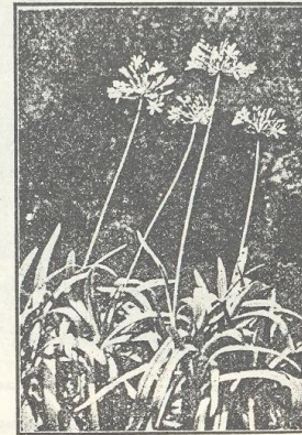
Agapanthus umbellatus ziedos.

telpās (+6—8° C.), vasaras vidū der izlikt laukā, āra gaisā, lai augums pilnīgāk nobriest.